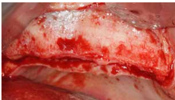
Figura 4 – Aspecto clínico após rebatimento do retalho. Nota-se por transparência a região do seio maxilar.

O procedimento iniciou-se com a realização de bloqueio anestésico dos nervos alveolar superior posterior, médio anterior, palatino maior e nasopalatino, com solução de mepivacaína 2% com vasoconstritor 1:100.000 (Dfl, Rio de Janeiro-Brasil), seguido de uma