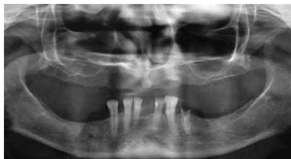
Figura 3 - Exame de imagem evidenciando a pneumatização dos seios maxilares.