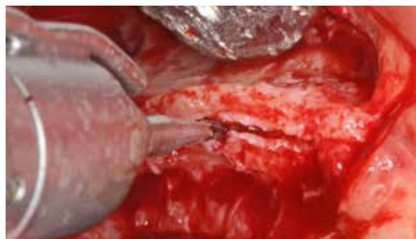
Figura 5 – Osteotomia com broca 701 acoplada em peça reta, sendo iniciada na crista do rebordo, visando à separação das corticais ósseas.

Dando sequência ao ato cirúrgico, foi realizada uma osteotomia horizontal na crista do rebordo, associada com duas osteotomias verticais na face vestibular, bem como levantamento da membrana sinusal. A expansão do rebordo foi realizada através de cinzéis “bico de pato” conseguindo-se excelente afastamento entre as corticais ósseas vestibular e palatina (Figuras 5-7).