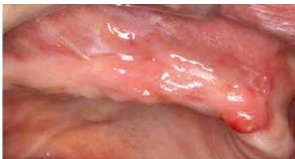
Figura 2 - Vista clínica lateral mostrando a pouca espessura para instalação dos implantes.