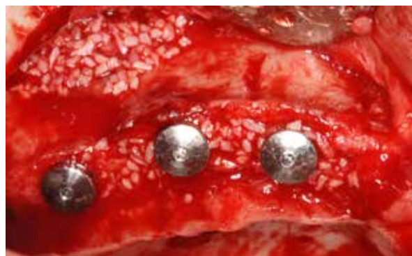
Figura 10 – Seio maxilar e espaços entre implantes totalmente preenchidos com biomaterial bovino. Isso visa impedir a invasão dos tecidos moles, bem como homogeneizar o rebordo.