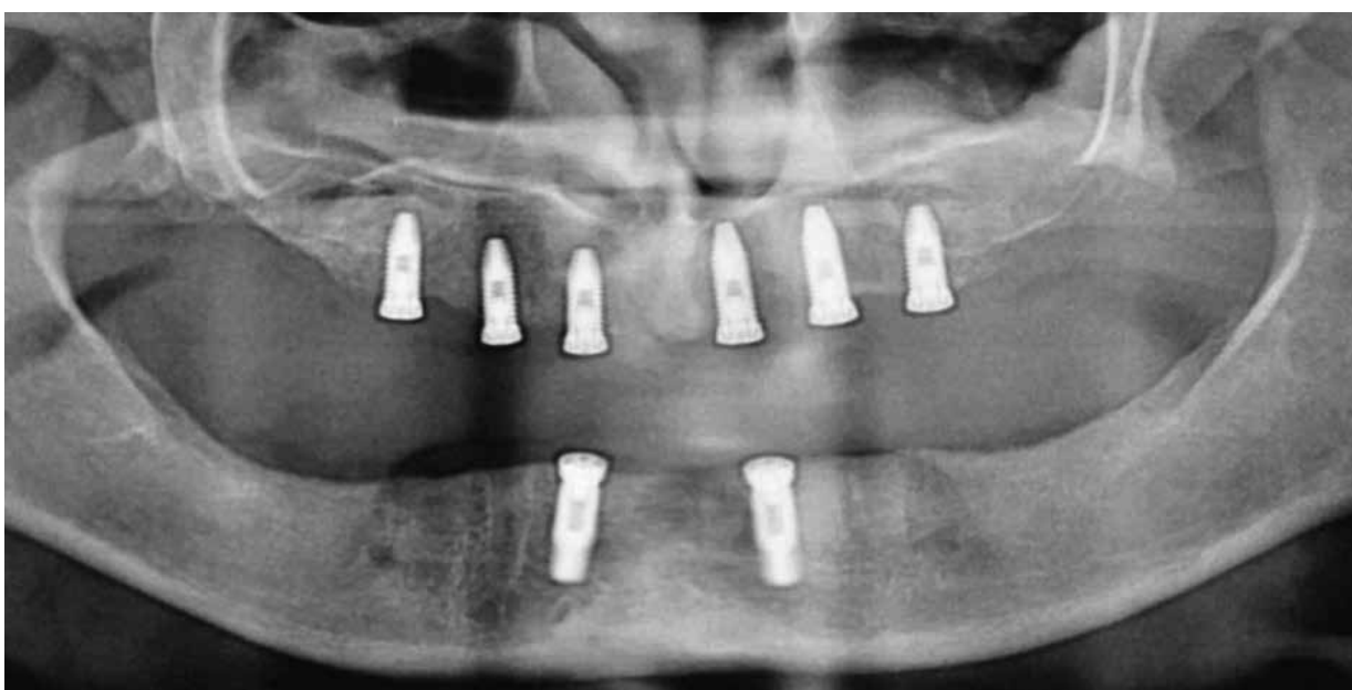
Figura 11 – Radiografia panorâmica com os 6 implantes maxilares instalados, conforme planejamento inicial. Nota-se o excelente paralelismo alcançado.