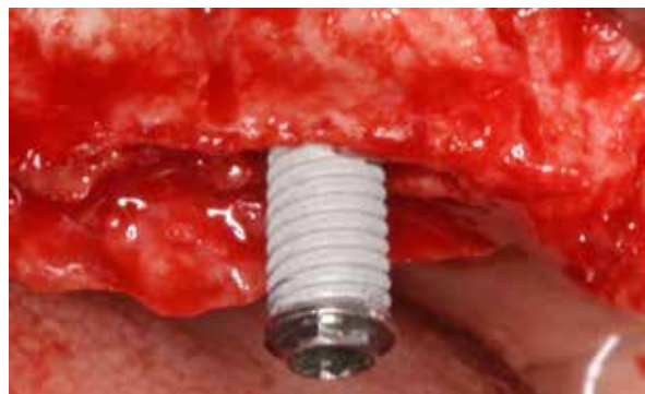
Figura 8 – Instalação de implante 4.0 x 11,5 mm sendo realizada na área expandida (Master Grip, Conexão).