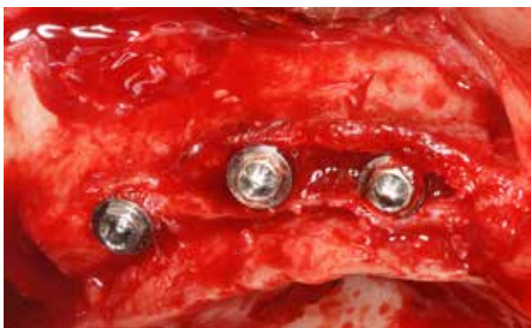
Figura 9 – Após instalação dos 3 implantes do lado direito, observa-se os espaços que necessitam ser preenchidos com biomaterial.