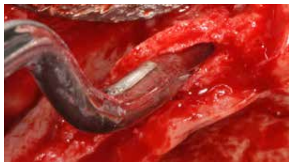
Figura 7 – Nota-se o excelente afastamento entre as corticais, o que vem a significar um considerável ganho na espessura óssea.